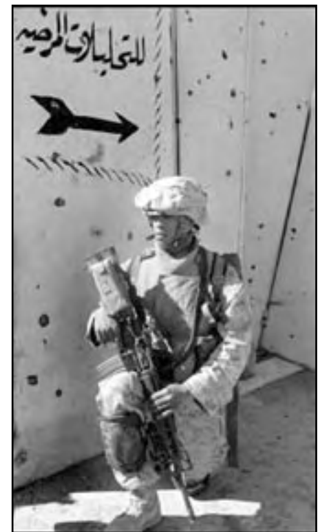
Un solda na warda na Kusyibah.

WASHINGTON— Estados Unidos a defende ayera uso cu el a haci aña pasa di municion cu fosfor blanco contra rebeldenan den e bataya di Faluya, na Iraq, pero a desmenti cu e civilnan tabata blanco. E sustancia no ta prohibi pa ningun tratado internacional. E agente a wordo usa durante loke un corant di e ehersito Mericano a yama misionnan instantaneo, contra rebeldenan aña pasa. Nos a usa fosfor blanco, como cualkier otro arma